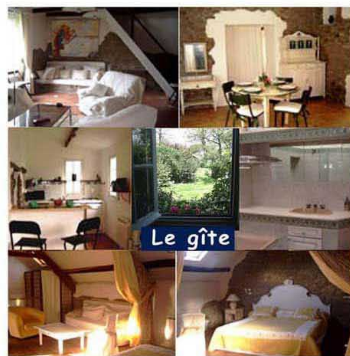
Cuisine équipée: four, lave-vaisselle, micro-ondes...