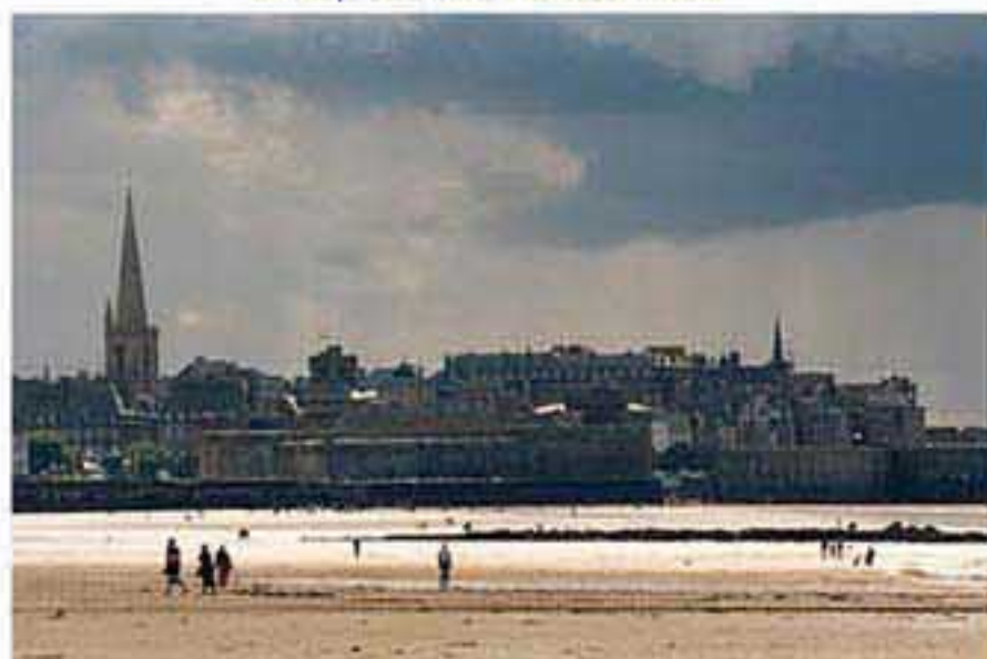
Saint-Malo: plage du Sillon