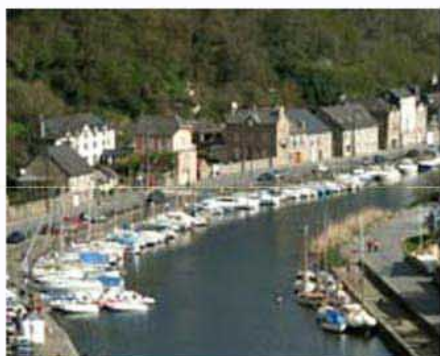
Le port de Dinan