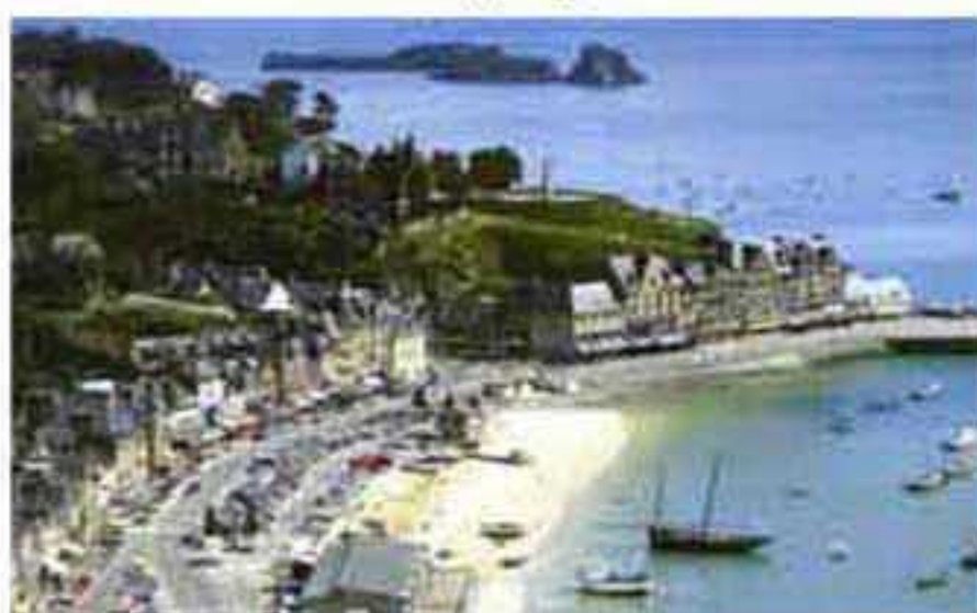
Cancale: le port de La Houle

Le clos de Calaudry est un point de départ idéal vers les nombreux sites touristiques environnants.